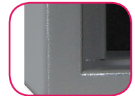
Épaisseur paroi 25mm