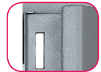
Épaisseur porte 100mm