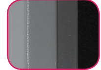
Épaisseur paroi 75mm