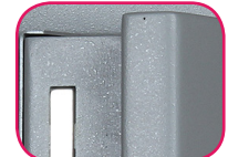
Épaisseur porte 105mm