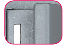
Épaisseur porte 105mm