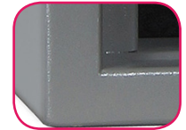
Épaisseur paroi 40mm