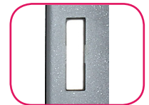
Pènes rectangulaires sur les 4 côtés