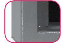
Épaisseur paroi 25mm