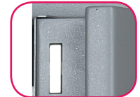
Épaisseur porte 100mm