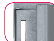
Épaisseur porte 100mm