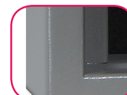
Épaisseur paroi 25mm