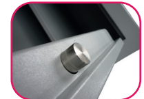
Pênes diamètre 25mm